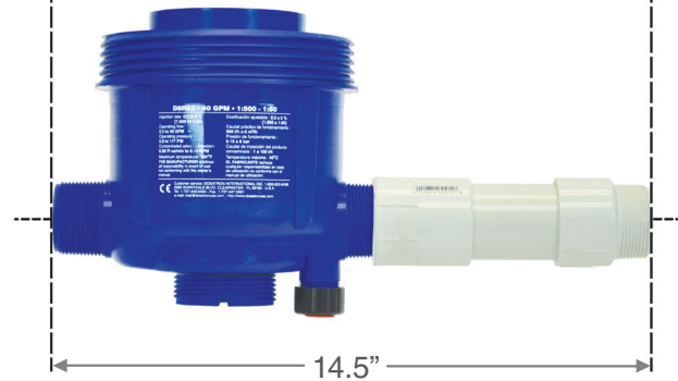
Series D8RE / D40MZ